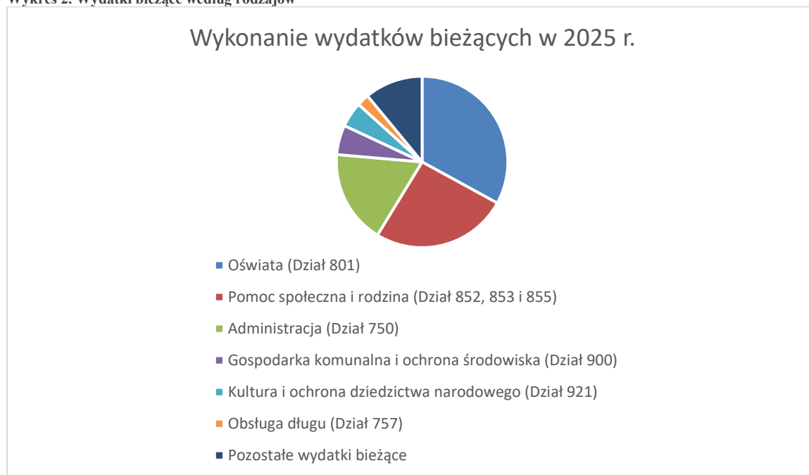
Wykres 2. Wydatki bieżące według rodzajów